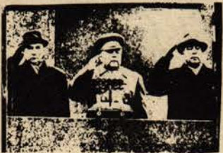
Kapak resmi: Kosigin(sol), Greçko(ortada), Brejnev(sağda)

Bugün üçüncü bir dünya savaşı tehlikesi vardır. Yurdumuz sosyal - emperyalizmin saldırı tehdidi altındadır. Bu şartlarda iki süper devlete karşı mücadele esastır. TSİP çatısı altındaki devrimcileri, iki süper devlete ve onun işbirlikçileri olan M.C. faşistlerine, TİP, TSİP'e ve savaş tehlikesine karşı devrimci saflarda birleşmeye ve mücadeleye çağırıyorum.