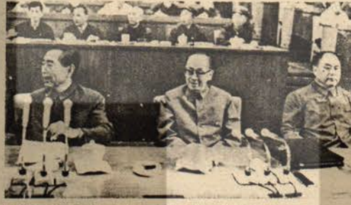
Kang Şeng (ortada), Çin Komünist Partisi 10. Kongresinde, Başkanlık Divanı kürsüsünde. Solda Chu En-lay, sağda ise Li De-şeng görülüyor.

Çin Komünist Partisi'nin önde gelen yöneticilerinden Kang Şeng, uzun süren bir hastalıktan sonra 16 Aralık 1975'te Pekin'de ölmüştür. Çin halkının toprak devrimi savaşı yıllarından beri ÇKP Merkez Komitesi üyesi olan Kang Şeng, 1966-1969 yılları arasında ÇKP Merkez Komitesi'ne bağlı Kültür Devrimi Gurubunda yer almış, 1969'daki Dokuzuncu Kongre'de Merkez Komitesi Siyasi Bürosunun 5 kişilik Daimi Komitesi üyeliğine seçilmişti. Liu Şao-çi'ye karşı olduğu gibi Lin Biao'nun burjuva karargahına karşı mücadelenin de ön saflarında yer alan Kang Şeng, son olarak 1973'te yapılan ÇKP Onuncu Kongresinde, tekrar Siyasi Büro Daimi Komitesine ve ÇKP'nin beş başkan yardımcılığından birine seçilmişti.