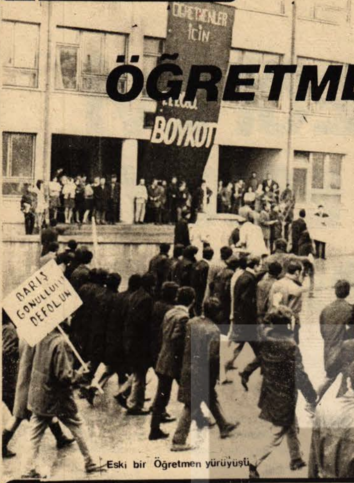
Eski bir Öğretmen yürüyüşü